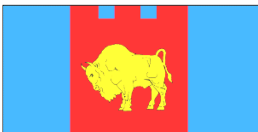
рисунок флага является реконструкцией по описанию; возможно цвета расположены не так...

Указом президента Республики Беларусь №446 от 14 сентября 2004 года учреждены герб и флаг Брестской области. Согласно официальному описанию флага области: